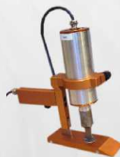
Manual Sliding System