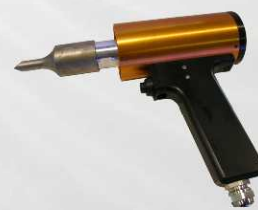
Pistola da taglio